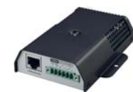
EMD (Dispositivo de monitoreo ambiental) para que pueda operar se necesita tener la SNMP instalada