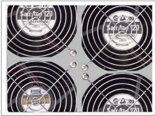
Velocidad de ventiladores controlado por nivel de carga