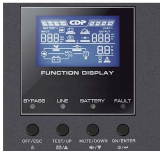
Display LCD Muestra voltajes de entrada, salida, tiempos de autonomía y carga de batería.