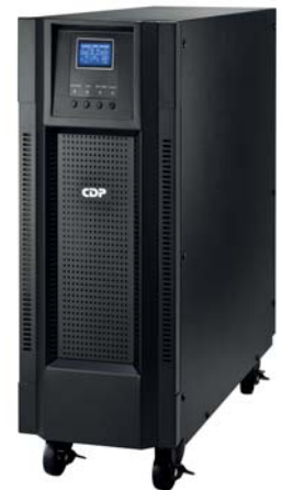
Display LCD Muestra voltajes de entrada, salida, tiempos de autonomía y carga de batería.