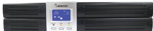
Vista de frente